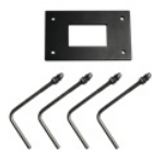
703098000300 LEDBollard-Luke-E Concrete-Mounting-Kit