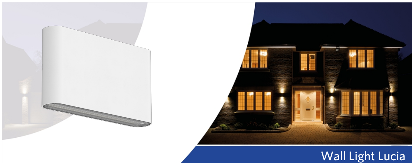
Wall Light Lucia