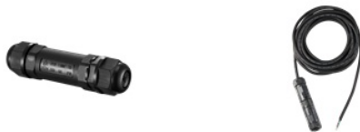
543098021900 LED Fixture-IP68-Connector-Kit-3