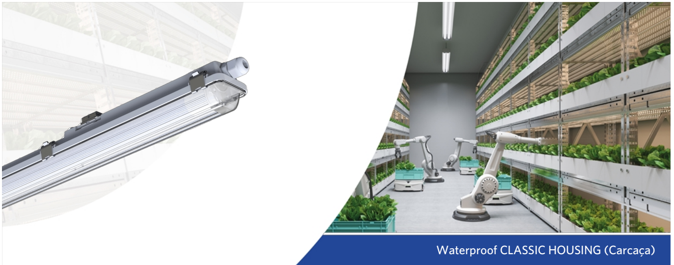
Waterproof CLASSIC HOUSING (Carcaça)