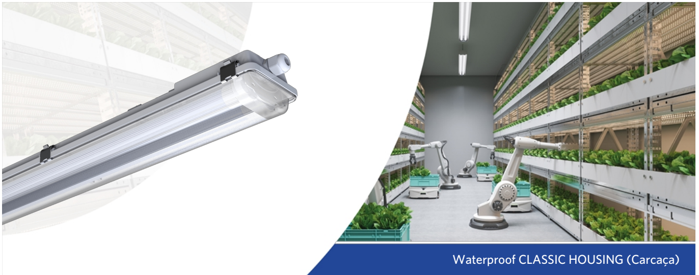
Waterproof CLASSIC HOUSING (Carcaça)