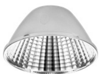
550098000300 LEDSpot3C-C-P R85-Reflector-24D