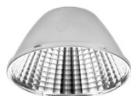
541001187800 LEDspot3C-C-CS R47-Reflector-24D