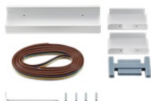
599006008900 LEDLima Connection-Kit