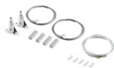
599006009000 LEDLima Suspension-Kit