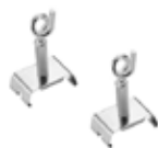
Abrazadera de montaje con gancho