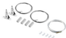
599006009000 LEDLima Suspension-Kit