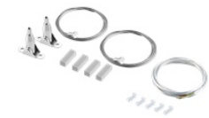
599006009000 LEDLima Suspension-Kit