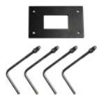
703098000300 LEDBollard-Luke-E Concrete-Mounting-Kit