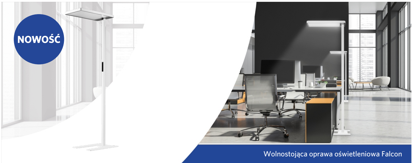
Wolnostojąca oprawa oświetleniowa Falcon