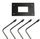
703098000300 LEDBollard-Luke-E Concrete-Mounting-Kit