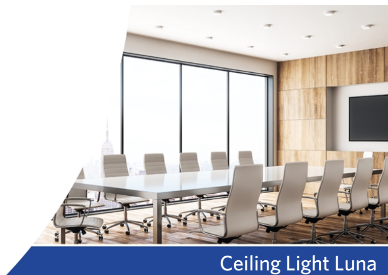
Ceiling Light Luna