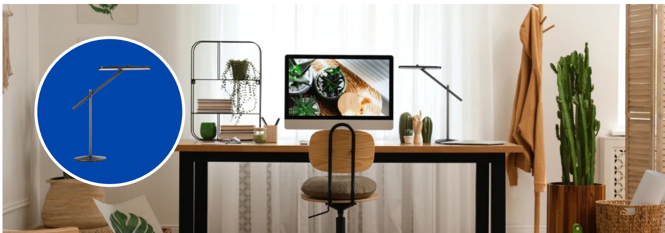
Lampa biurkowa Balance