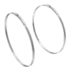
709098001600 FloodOly-P Mounting-Kit-Out-Pole