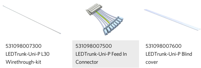
531098007300 LEDTrunk-Uni-P L30 Wirethrough-kit