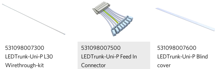
531098007300 LEDTrunk-Uni-P L30 Wirethrough-kit