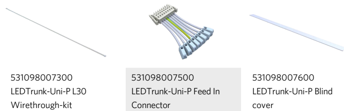
531098007300 LEDTrunk-Uni-P L30 Wirethrough-kit