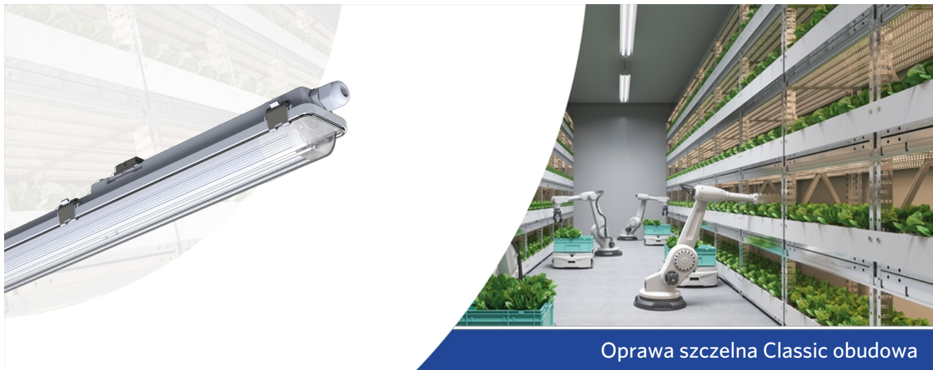
Oprawa szczelna Classic obudowa