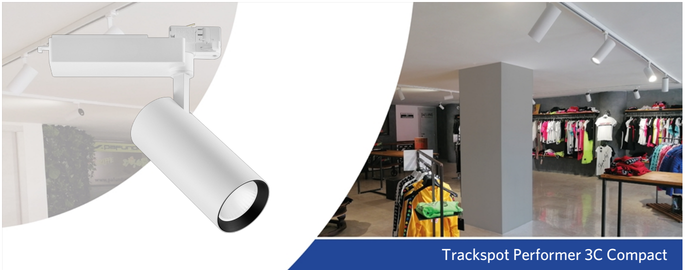
Trackspot Performer 3C Compact