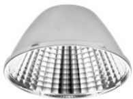
550098000300 LEDSpot3C-C-P R85-Reflector-24D