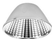
541001187900 LEDSpot3C-C-CS R68-Reflector-24D